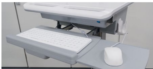
Medisinske tastatur og mus passer perfekt til bruk på feks. en DPH uten motor.

Alle våre hygieniske, medisinske tastaturer kan leveres som QWERTY. Tastaturer og mus kan kjøpes separat. Siden vi selv utvikler produktene våre er kort leveringstid mulig. Kvalitet, brukervennlighet og hygiene kjennetegner de produktene vi leverer. Vi tilbyr medisinske tastaturer og mus som passer alle typer budsjetter og behov. Vi gir deg gjerne råd om hvilken type tastatur og mus som passer best til din medisinske arbeidsstasjon.